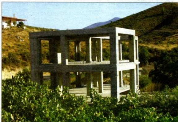
Πάνω μέλη της Ένωσης Εργασίας από την Ήννα επισκενάζουν το παλιό σχολείο στον Παραθύρο. Κάτω το νέο κτίριο της «Ένωσης» στην Καρνούπολη που ευελπιστούν ότι θα στεγάσει τους σκοπούς και στόχους του παρόντος και του μέλλοντος.

Pressereferentin / Organisation Stapellauf Ger-Mani: Dagmar Zintl, Villingen-Schwenningen Tel.: 07720 / 957855